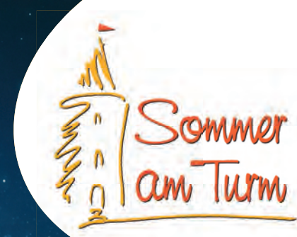
Illustration: © 2024 Laura Trolier